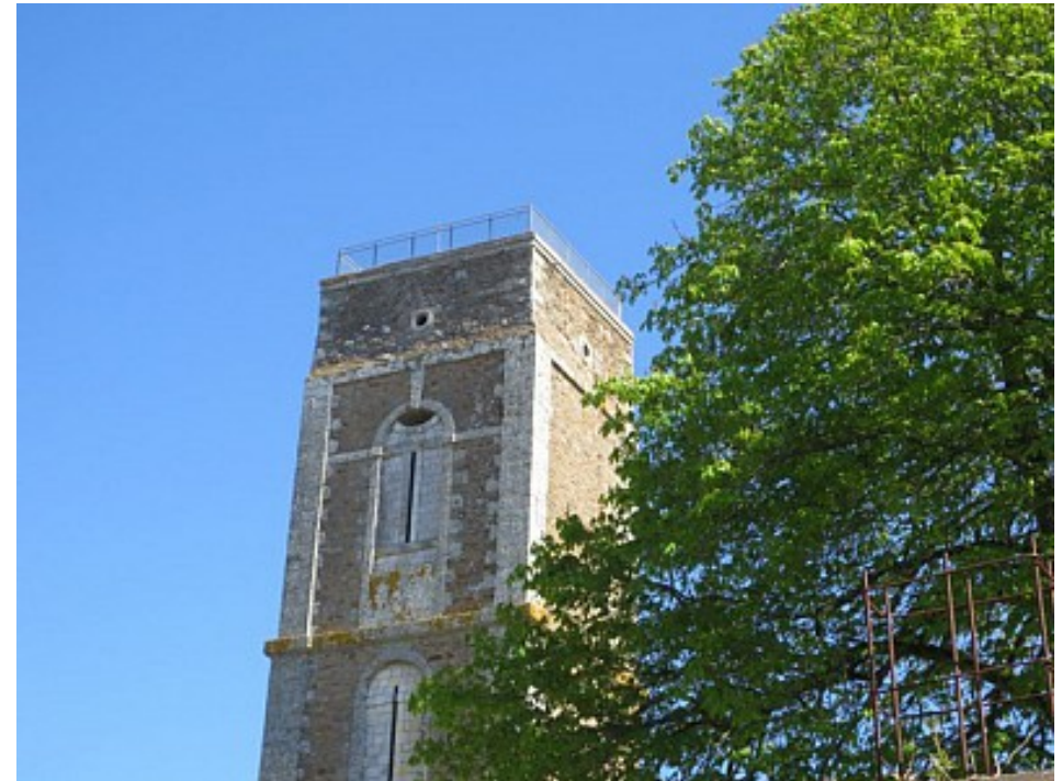
Tourisme Arc Sud Bretagne

Cette ancienne abbaye cistercienne, fondée en 1252 par le premier bâtisseur de Suscinio : le Duc Jean 1er Le Roux, est aussi son lieu d'inhumation. Après la Révolution, le site n'a conservé de cette époque florissante que quelques vestiges: son entrée, les anciennes fermes, l'hostellerie et des éléments de l'ancienne abbatale dont la tour. Quelques pierres emblématiques sont présentes sur le site, des stèles gauloises et ...la "Pierre à soles" qui conserve des gabarits de poissons gravés dans le granit, les moines avaient des droits sur la pêche et en prélevaient leurs parts.