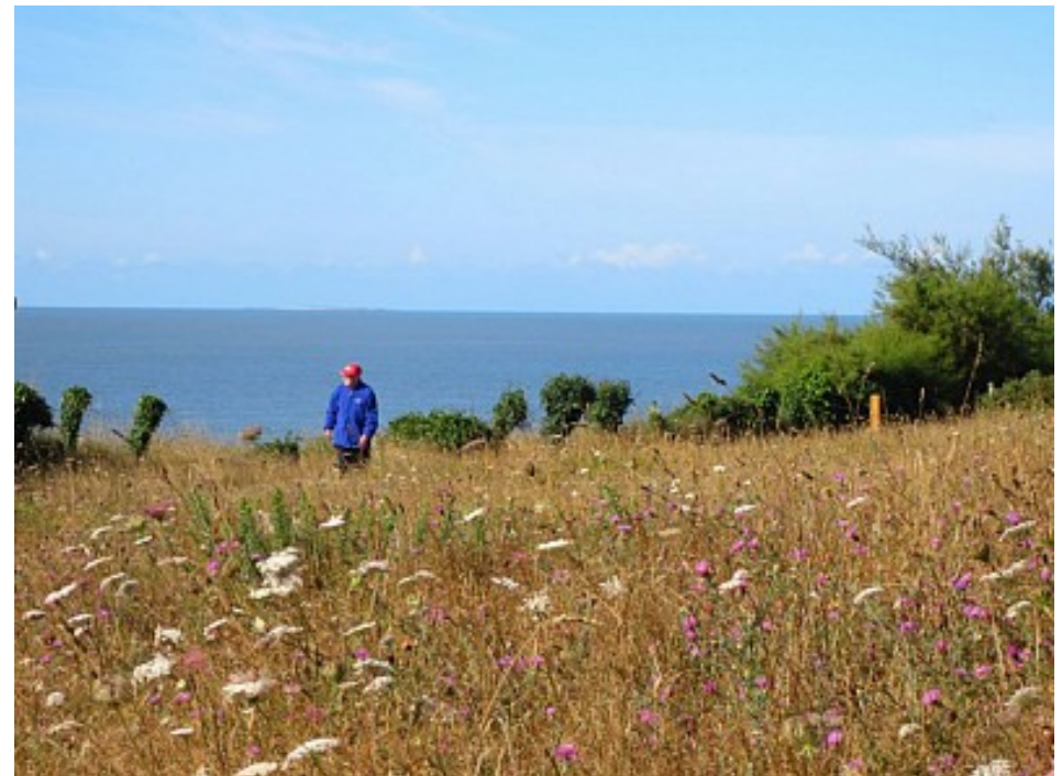
Tourisme Arc Sud Bretagne | Morbihan

Entre la plage des Granges et la pointe de Pen-Lan, vous longez une prairie littorale, écosystème particulier qui se distingue par une qualité et une préservation d'espèces végétales et animales rares. Ce site naturel est limitrophe du site mégalithique du Cairn des Grays d'époque Néolithique et classé Monument Historique.